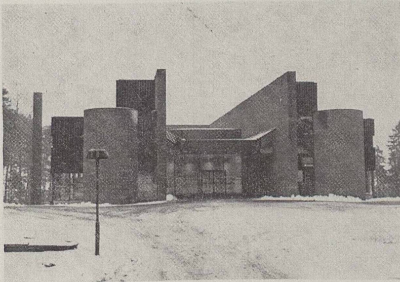
Skólahús IBM í Stokkhólmi.

harmaði, því hann sagðist álíta, að þetta væri kjörið starf fyrir konur, þar sem eðliskostir þeirra gætu vel notið sín. Orsökina fyrir þessu áhugaleysi kvenna sagðist hann ekki vita,